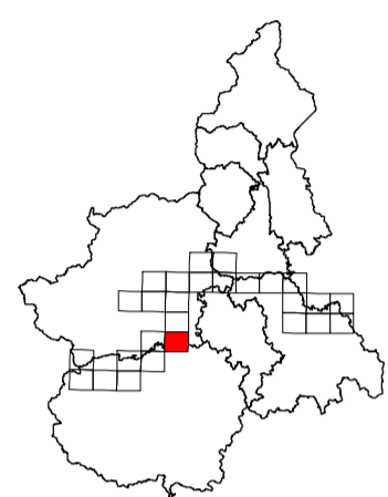
TAVOLA 174 SO