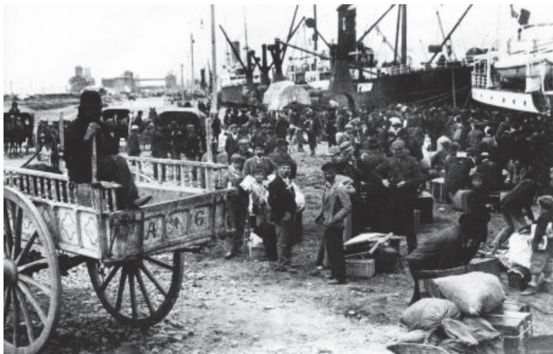
Argentina, Buenos Aires, 1900 circa. Carretti che trasportano gli emigrati sulla terraferma

E il tema della migrazione continuerà ad essere frequentato per anni, passando dal canto popolare alla musica leggera fino ai giorni nostri. Un'epopea che offre lo spunto per raccontare la storia collettiva e il dettaglio di ogni vita.