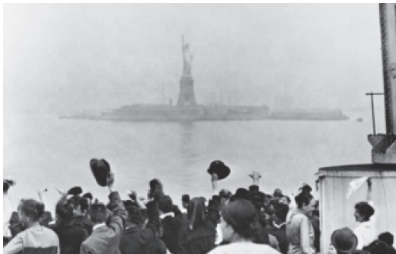
Gli emigranti dalla nave salutano festosi la statua della Libertà a New York

In pochi anni nei decenni a cavallo tra la fine dell'800 e l'inizio del '900, furono quattro milioni i nostri connazionali che si diressero verso gli Stati Uniti, in particolare New York raccolse circa un terzo dell'intera cifra.