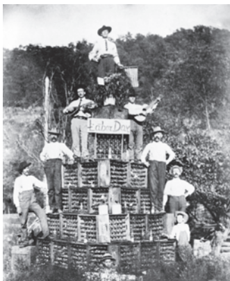
Scalpellini della Valle Cervo, Festa del Lavoro. USA, West Virginia, 1904

O compagni che restate combattete anche per noi anche lontani siam con voi pronti a batterci e lottar.