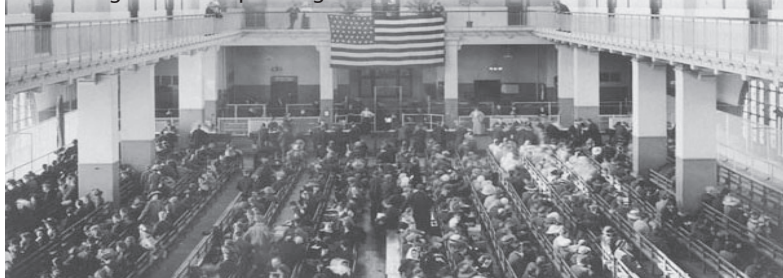
La sala di registrazione di Ellis Island

Vedersi rifiutare il permesso di ingresso voleva dire non poter allontanarsi da Ellis Island per essere rispediti nel paese di origine, reimbarcati a forza sul primo piroscafo in partenza. A volte ciò significava la straziante separazione delle famiglie con il capofamiglia unico ad essere accettato.