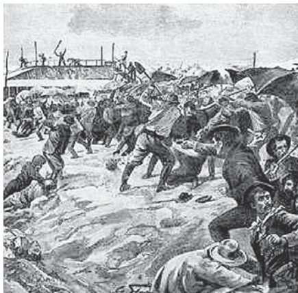
L'attacco ai lavoratori italiani, G. Stern, 1893